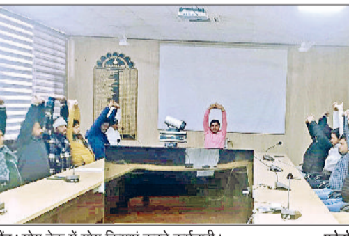
जींद। योग ब्रेक में योग क्रियाएं करते कर्मचारी।