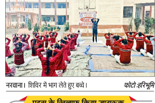
नरवाना। शिविर में भाग लेते हुए बच्चे।