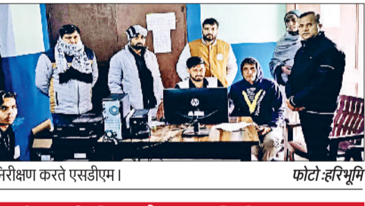
जींद। निरीक्षण करते एसडीएम।