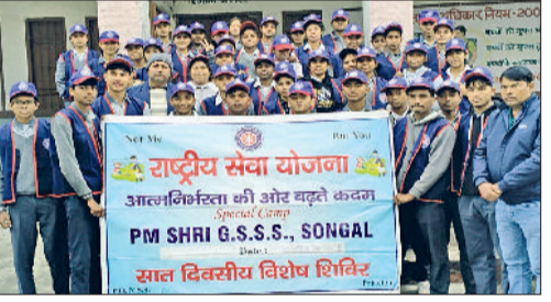
राजौड़। कार्यक्रम में भाग लेते विद्यार्थी व स्टाफ सदस्य।