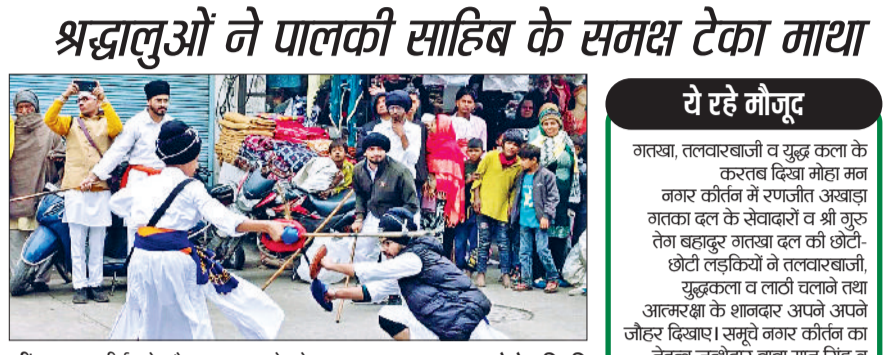
श्रद्धालुओं ने पालकी साहिब के समक्ष टेका माथा